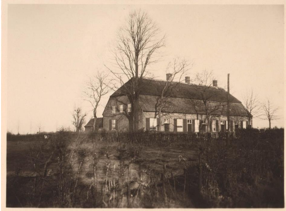
Torentjeshoef in 1920. Hier nog 6 woningen.