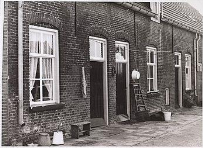
Achterkant Torentjeshoef in 1959